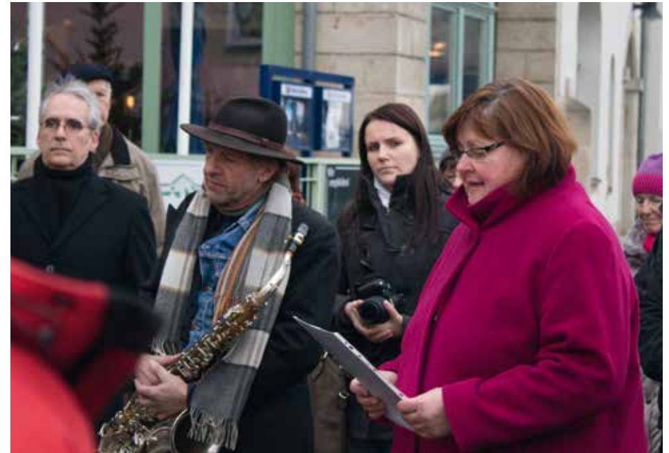
Stolpersteine-Verlegung des Bürgernetzwerkes »Laubegast ist bunt« am 5. 12. 2014

kurse für Anfänger und Fortgeschrittene im Bürgersaal des Rathauses Leuben. Auch in Prohlis hat ein entsprechendes Bündnis seine Arbeit aufgenommen.